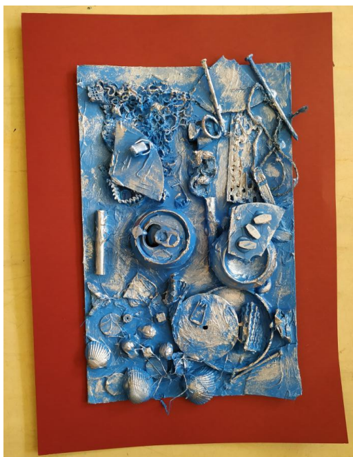
Práce žáků výtvarného kroužku